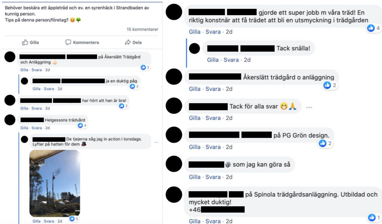
Bild 2 - Trädstartaren (TS) söker kunnig person Bild 3 - TS visar tacksamhet

I både nätgemenskaperna förekom inlägg där medlemmar antingen delade med sig av rekommendationer för diverse företag, tjänster eller privatpersoner som de anlitat eller att medlemmar efterfrågade personliga rekommendationer från övriga medlemmar.