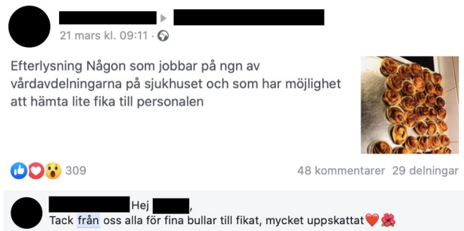
Bild 10 - TS söker budbärare för att visa uppskattning för vårdpersonal.

hur sköldpaddan mår och vad som kommer att hända med den därefter.