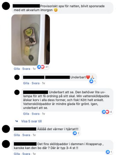
Bild 9 - TS visar provisoriskt hem för djuret.

Från den netnografiska studien identifierades inlägg där trådskaparen (TS) söker hjälp/råd av olika slag, vilket kunde innebära som i bild 8 eller bild 10 där TS efterlyser hjälp av andra medlemmar.