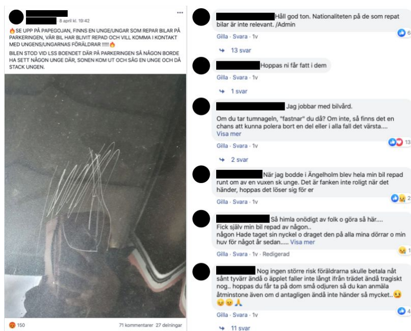
Bild 5 - Administratör uppmanar till hålla god ton

I Bild 5 skriver trådskaparen (TS) att sin bil blivit repad av en unge/ungar och därmed upplyser ungens föräldrar och eventuella vittnen. TS har bland annat använt flertal utropstecken samt enbart versaler, vilket indikerar att TS är upprörd. Flertal kommentarer läggs men ingen övrig medlem hänvisar till TS ton i inlägget. Däremot tar administratören sin roll och uppmanar till att hålla en god ton och att nationalitet på de som repat bilen inte är relevant. En tolkning kan vara att rasistiska kommentarer har skrivits men blivit borttagna.