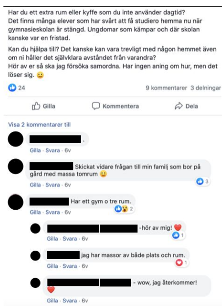
Bild 13 - Medlem söker rum.

Andra typer av inlägg som kategoriseras in i temat Hjälpksamhet var bortskänkning. Syftet med bortskänkningsinlägg är att TS önskar att får bort föremål som TS ej behöver som istället kan glädjas av någon annan. Bild 12 visar på ett exempel där TS skänker bort sina ormbunkar gratis mot avhämtning. I kommentarsfältet finns där flertal medlemmar som är intresserade. Dessa typer av inlägg visar att det finns ett stort engagemang för att hjälpa andra medlemmar i gruppen. Bild 13 är ett annat exempel där TS gör en efterfrågan och får positiv respons från övriga gruppmedlemmar. Flera medlemmar engagerar sig och erbjuder plats vilket ytterligare visar på medlemmarnas vilja att ställa upp och att dela med sig.