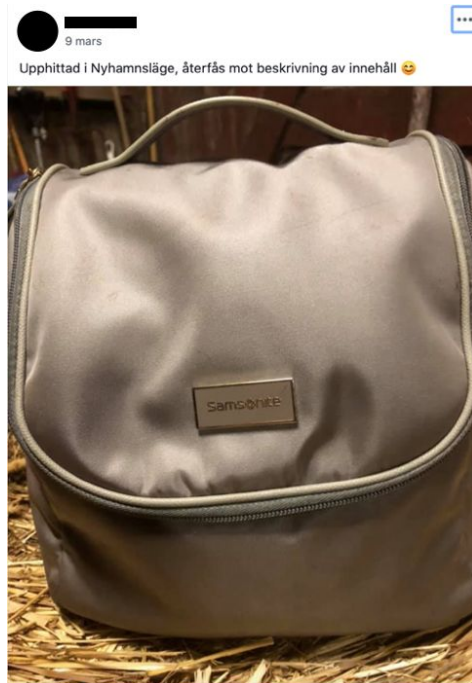
Bild 16 - Upphittad väska.

Trots att bortsprungna husdjur är vanligt inom temat, förekommer även borttappade föremål. Bild 14 är ett liknande inlägg som behandlar ett upphittat föremål. I beskrivningen av inlägget står det området väskan var hittad och att den återfås mot beskrivning av innehållet.