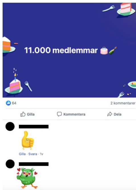
Bild 1 - Antalet medlemmar

I frågan rörande om informanten kunde rekommendera gruppen för andra, svarade samtliga informanter att de skulle göra det. Informant 6 motiverade ställningstagandet till att då kan viktig information spridas snabbare.