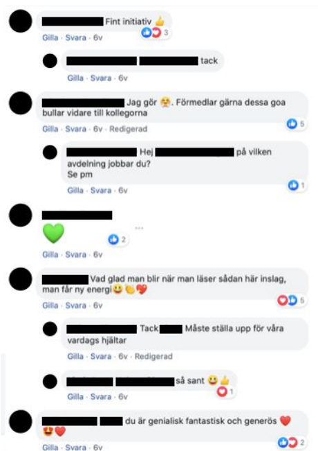
Bild 11 - Gruppmedlem erbjuder sig att förmedla vidare bullarna.