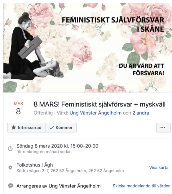
Bild 18 - Feministiskt självförsvar

I en intervju med Informant 5 berättade hen att nya bekantskaper hade anträffats i närområdet tack vare evenemang som anordnats i nätgemenskapen. Informant 1 berättade att gruppen hade medfört att de får en bättre överblick över vilka som bor i området och får ett namn och ansikte på grannar/boende. För Informant 4 blev det mer familjärt och gör att det är enklare att hitta rätt person för rätt sak.