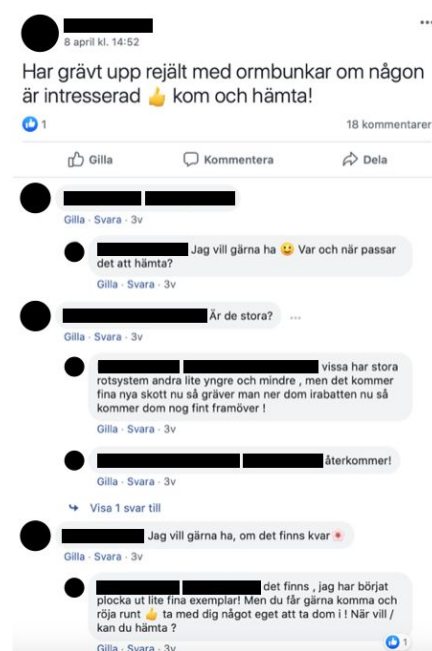
Bild 12 - Generös medlem skänker bort växter.

I bild 10 efterlyser TS en person som kan leverera hembakade bullar till vårdpersonal. Inlägget har fått 309 reaktioner, 48 kommentarer och 29 delningar. I kommentarsfältet får TS dels uppskattning och glädjande kommentarer från övriga medlemmar och dels finns där även flertal personer som kan ställa upp på att leverera bullarna.