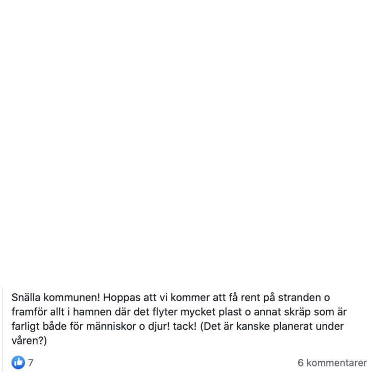
Bild 7 - Öppet brev till kommunen

Det fanns även inlägg där omröstningar skedde, ett exempel är bild 6 där en företagare ber om råd hos medlemmar ifall restaurangen ska vara öppna eller inte. Andra typer av inlägg där kommunal verksamhet diskuteras är i liknande karaktär som bild 7 där medlemmar skriver ett “öppet brev” till kommunen med diverse synpunkter eller frågor.