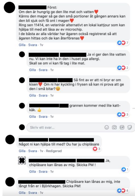
Bild 15 -Beröm till TS, tips om katten.

Antalet inlägg som visar på medlemmarnas medmänsklighet och känsla för att värna om djur är många. I bild 14 visas en inlägg på en katt som kommit vilse. Inledningsvis skrev TS om någon känner igen katten, men efter att ingen ägare dykt upp och andra medlemmar visar engagemang