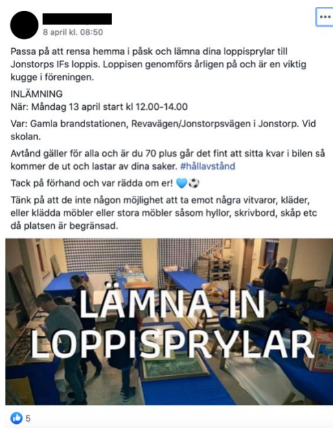
Bild 17 - Loppis evenemang evenemang

Under den netnografiska studien framkom aktiviteter som medlemmar arrangerar och deltar i gruppen till exempelvis loppisar, lunch-evenemang, gratis träningspass utomhus eller insamlingar förmån för organisationer eller individer. Det fanns även medlemmar som delade aktiviteter från andra grupper eller företag ( Bild 18 ).