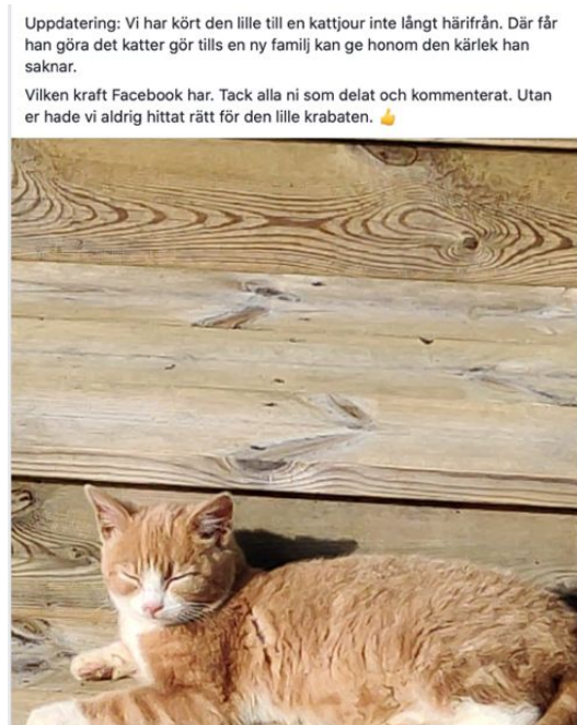
Bild 14 -Upphittad katt skickas till kattjour.

Under temat Värna om personlig egendom placerades inlägg som relaterade till upphittade och omhändertagning husdjur/föremål och efterlysningar av djur/föremål som kommit på villovägar. Inlägg kunde även ha en uppmanande karaktär, där trådskaparen vädjade till övriga medlemmar i gruppen att hålla ögonen öppna efter ett visst föremål. Vid upphittade föremål/djur belystes inte enbart var föremålet/djuret var upphittad/befanns sig utan trådskapare tog även ett större ansvar med att ta hem föremålet/djuret alternativt sökte råd om hur situationen skulle hanteras. I andra inlägg kunde TS även hänvisas att lämnat in de till Polisens hittegodsavdelning.