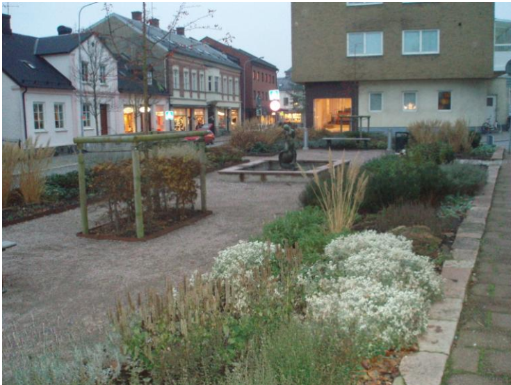
Bild 3. Planteringen Trekanten

Leda och svanen är placerad vid planteringen Trekanten i centrala Eslöv. Det är en delvis upphöjd yta mellan husen, omringad av vägar. Namnet Trekanten har funnits länge, kanske ända sen mitten av 1800-talet och kommer förmodligen ifrån att vägarna runt platsen bildar just en trekant. Det är inte mer än ett stenkast till stationen, medborgarhuset, stadsparken och Stora torg. Längs kanterna är det rabatter och ytan inuti är grusbelagd med några mindre träd och bänkar utplacerade. I mitten finns det nersänkta kar som skulpturen står i.