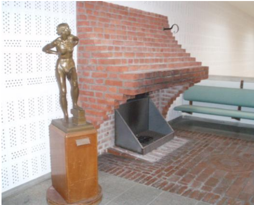
Bild 9. Eldstaden och Morgon på medborgarhuset.

När Morgon först kom till medborgarhuset placerades skulpturen i foajén. 95 Numera står den i andra änden av rummet intill eldstaden.