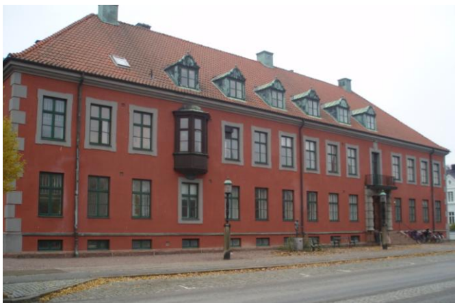
Bild 5. Gamla rådhuset, idag kulturskolan