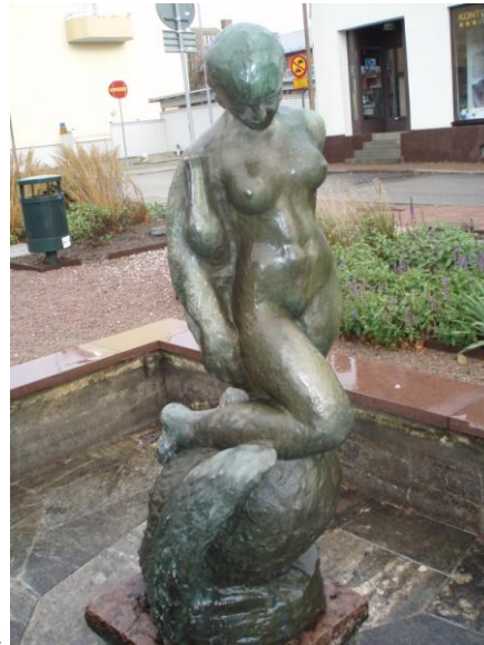
Bild 1-2. Leda och svanen